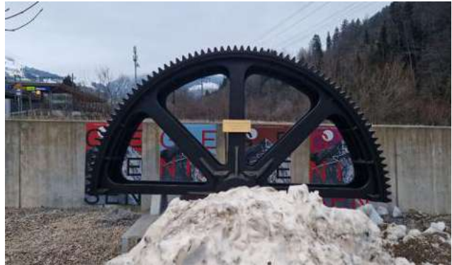
Photo: Destination finale de la moitié de la contre-roue de la 1re section, en service de 1947 à 2022.

Pour en savoir plus : niesen.ch/gschichtefahrte .