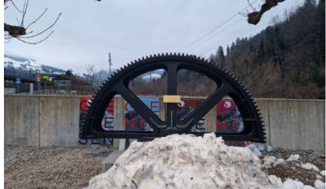
Foto: Endstation der Gegenradhälfte der 1. Sektion, 1947 – 2022 im Einsatz.