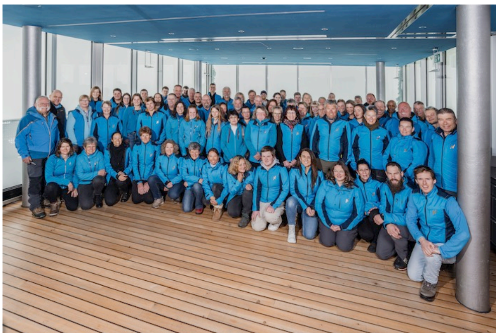
Das Niesen-Team anlässlich des Kick-Off-Anlasses zur Saisonvorbereitung 2023.