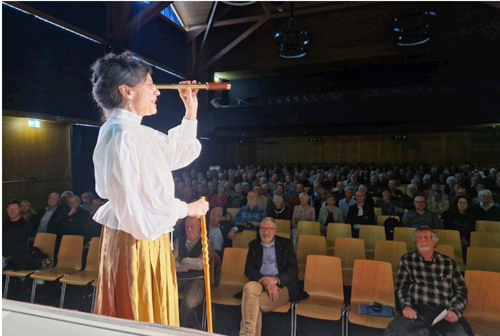
Das Stück «Gräfin Harrach» wird im August auf dem Niesen vorgeführt.