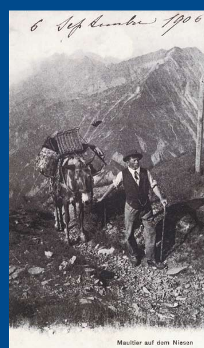
Maultier auf dem Niesen