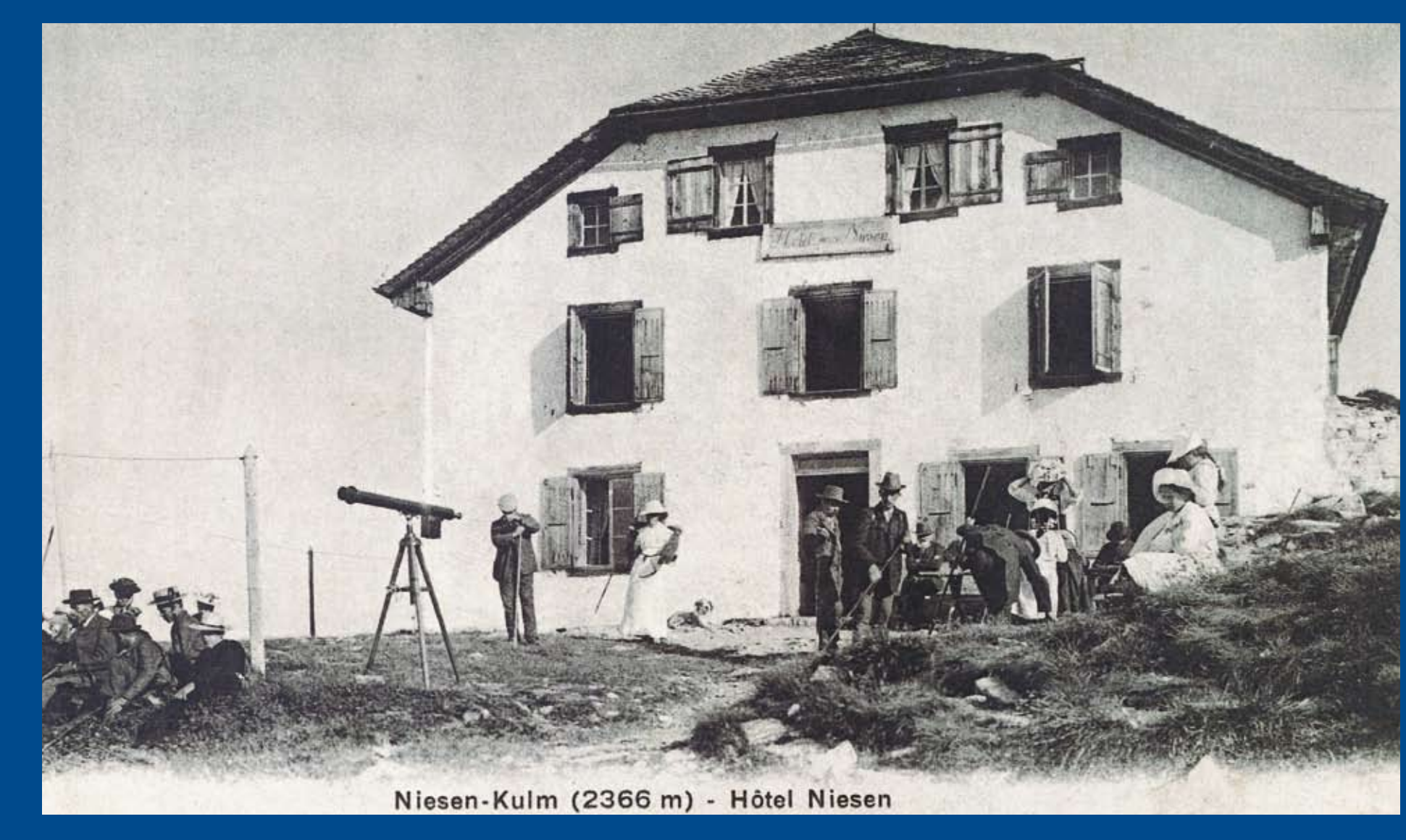
Niesen-Kulm (2366 m) - Hôtel Niesen