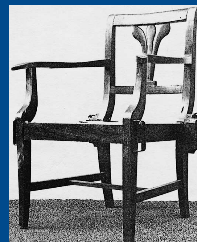
Tragstuhl mit seitlichen Latschen für die Tragholmen